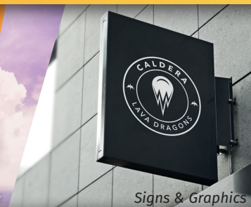
Signs & Graphics