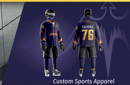
Custom Sports Apparel