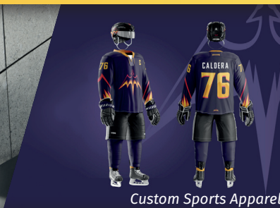
Custom Sports Apparel