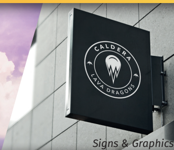
Signs & Graphics